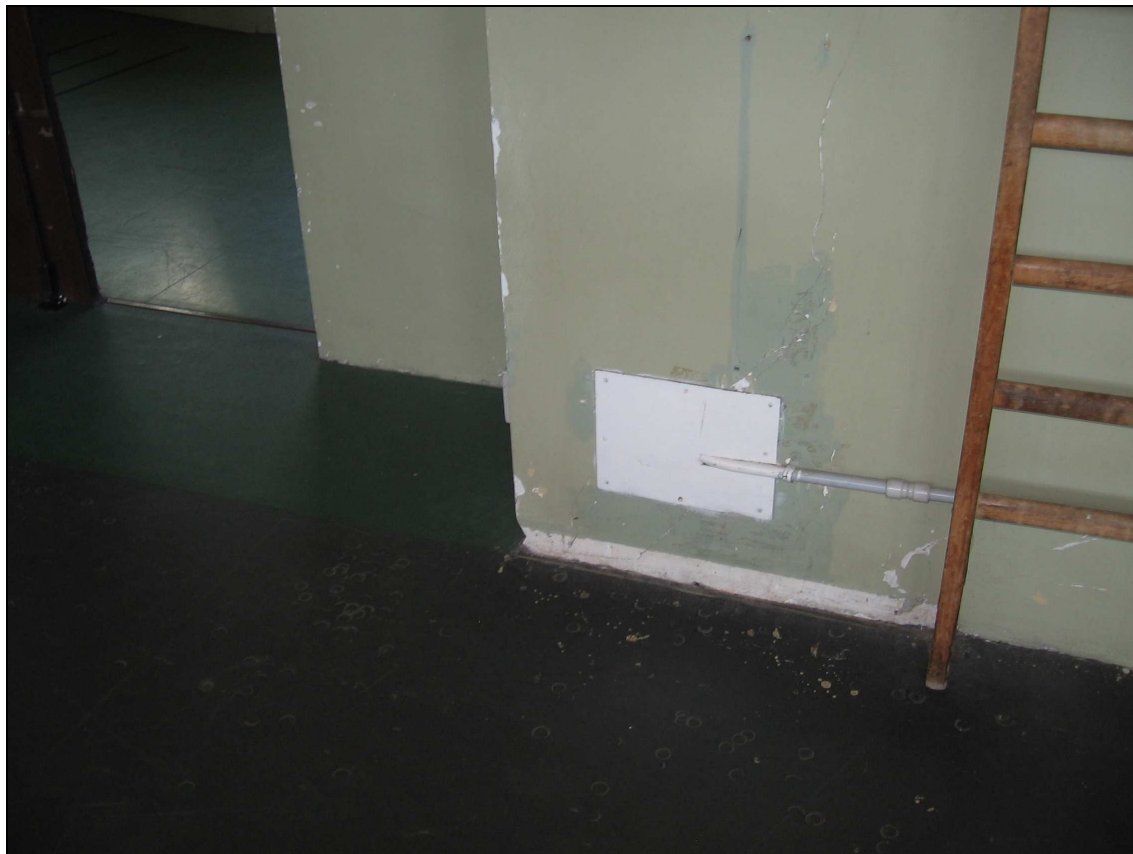
Foto n° 6 - Immagine particolare giunzione pavimento-muro ammalorato e senza zoccolino