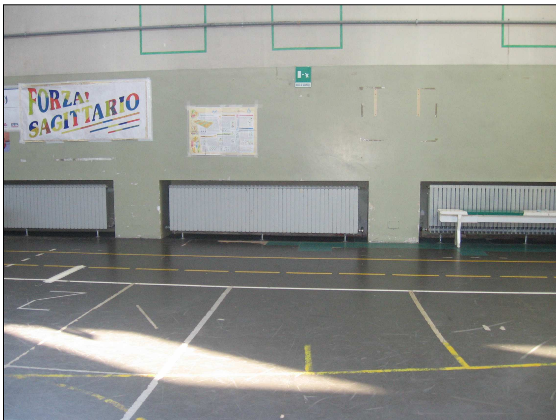
Foto n° 3 - Immagine di un lato palestra frontale all'entrata, particolare termosifoni