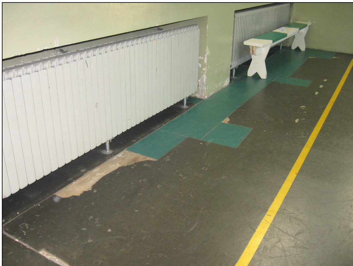
Foto n° 11 - Immagine particolare pavimento ammalorato e "rattoppato"