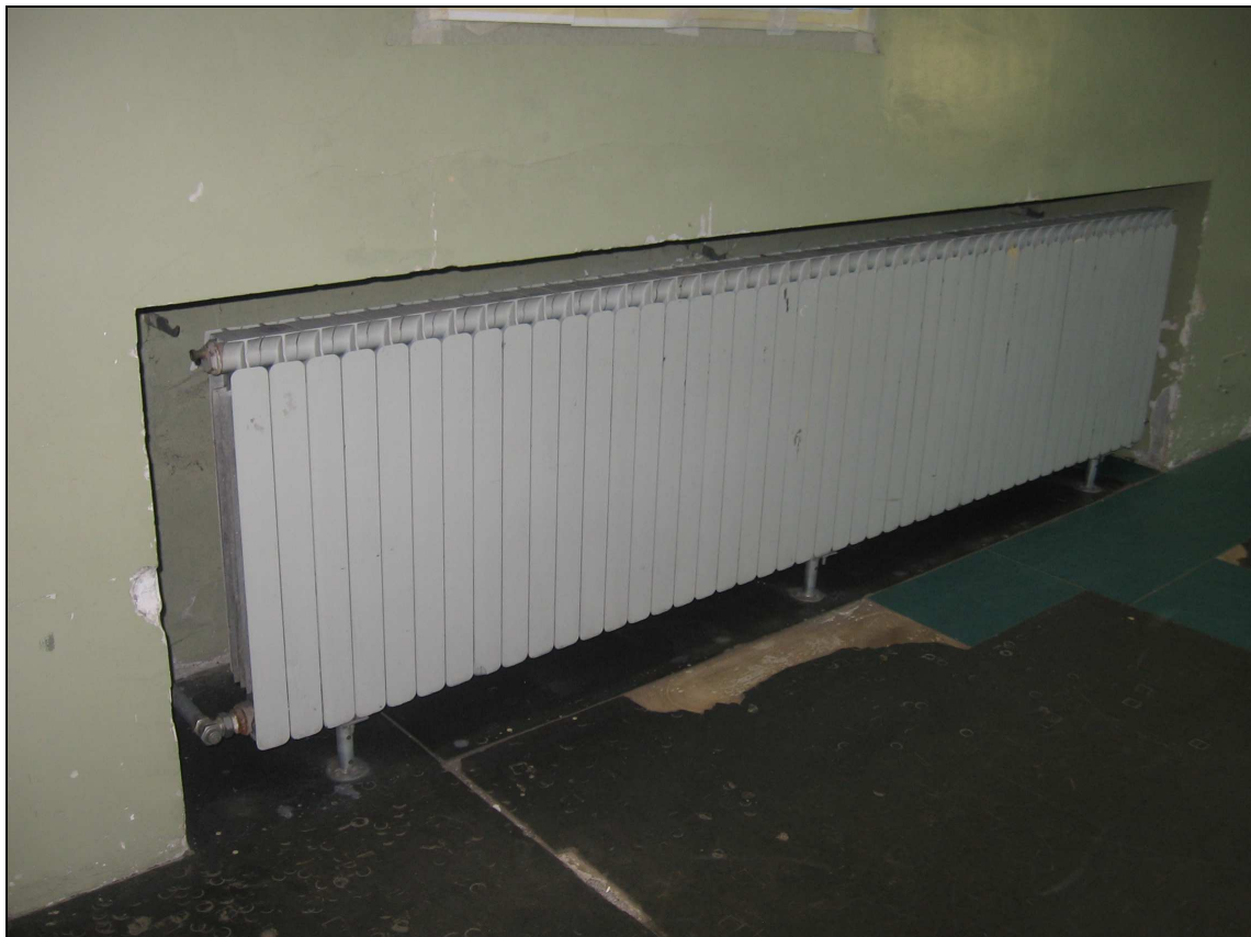
Foto n° 14 - Immagine di un termosifone e particolare pavimentazione ammalorata