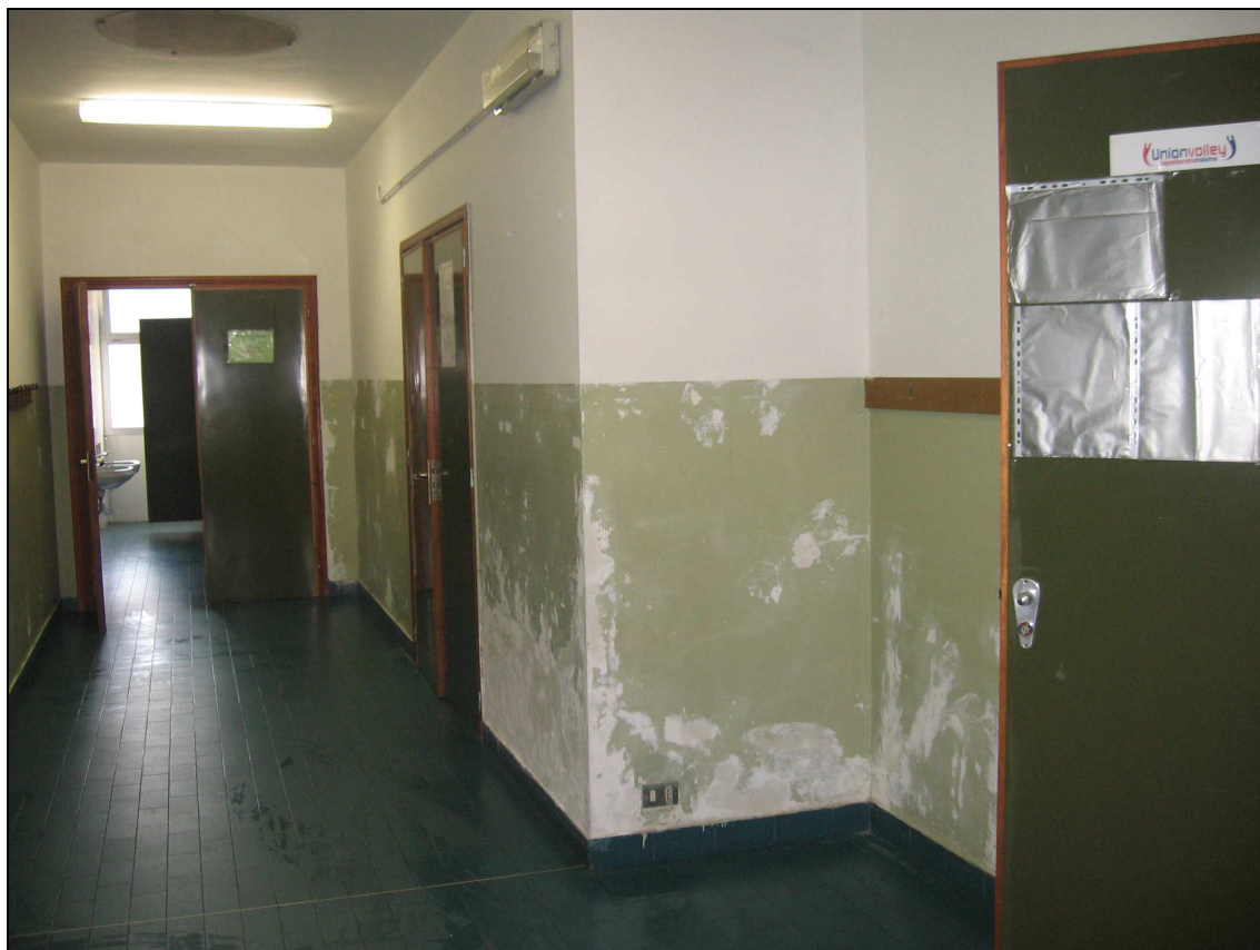
Foto n° 17 - Immagine del corridoio blocco bagni sull'entrata dei tre spogliatoi