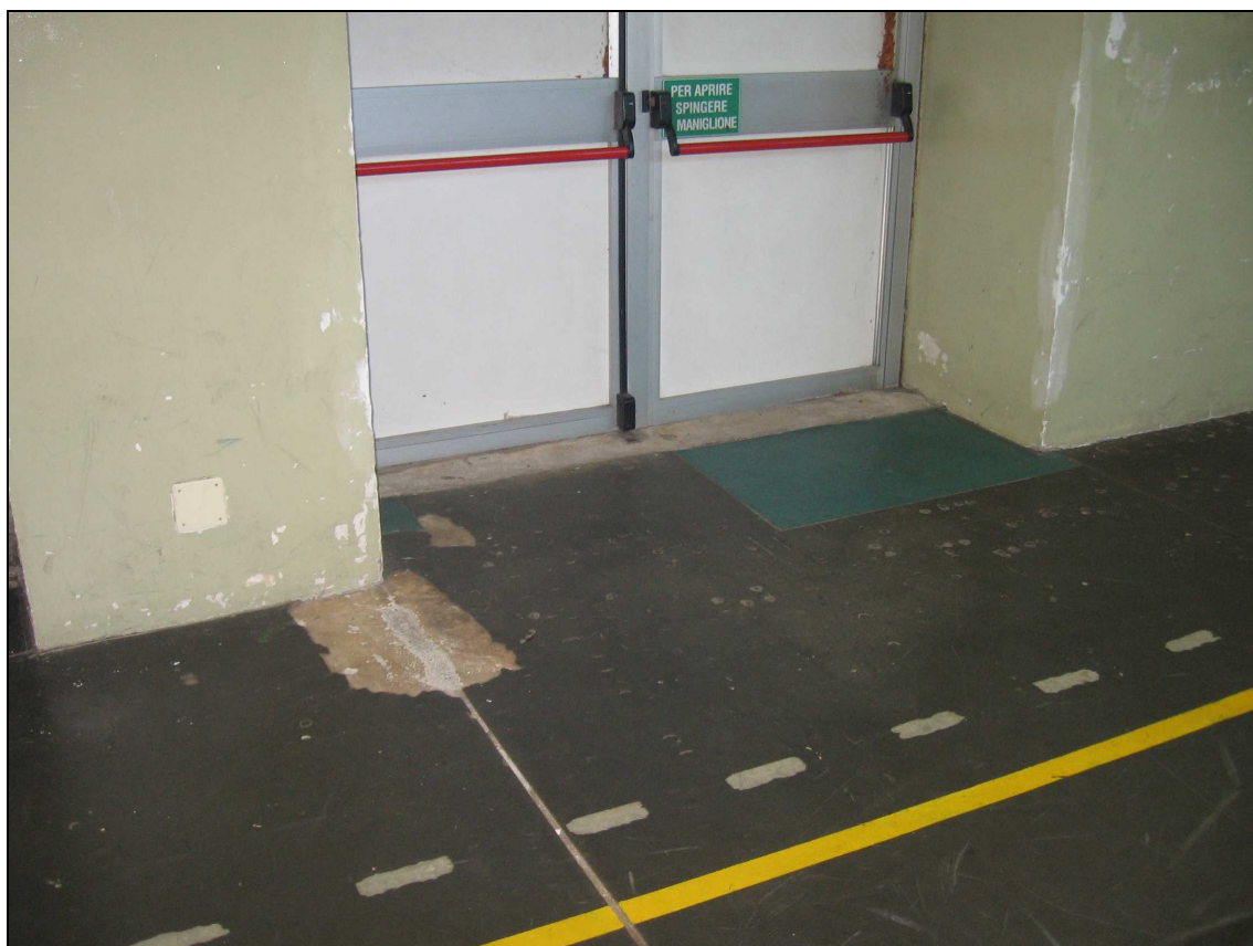
Foto n° 7 - Immagine particolare pavimento ammalorato e distaccato in vicinanza uscita di sicurezza