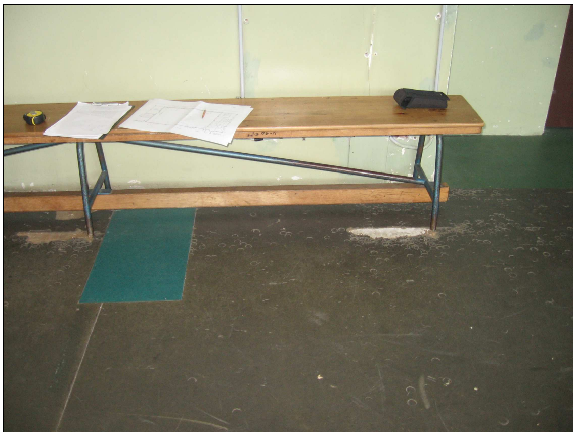
Foto n° 5 - Immagine pavimento ammalorato e rattoppi della palestra