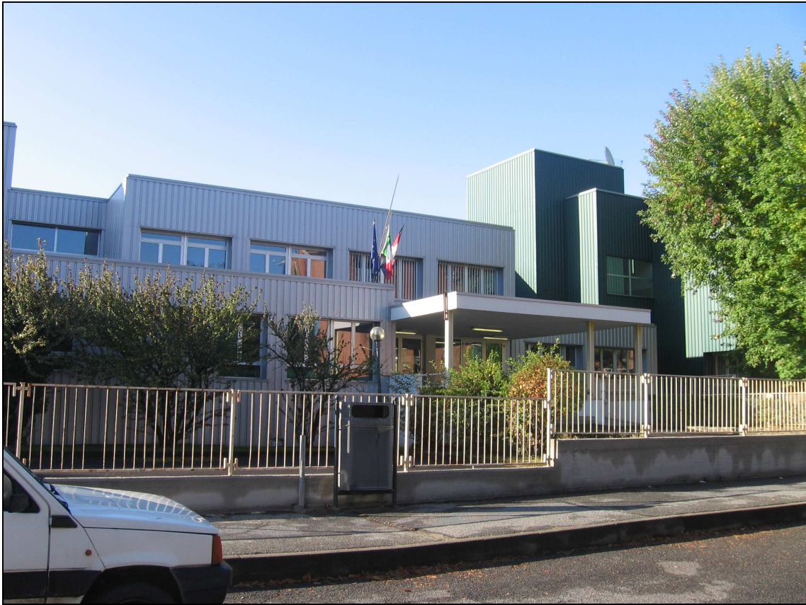
Scuola Fermi – Ingresso principale