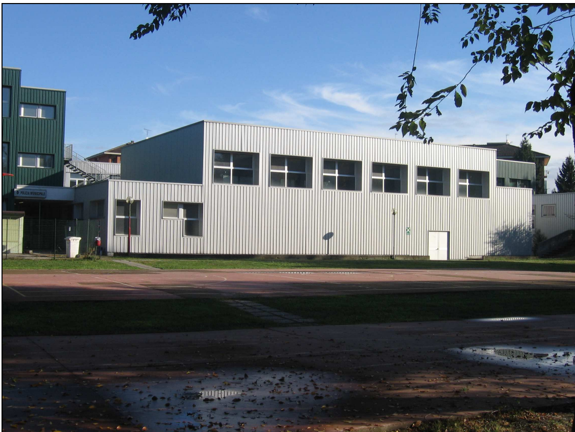
Scuola Fermi – Blocco palestra da cortile