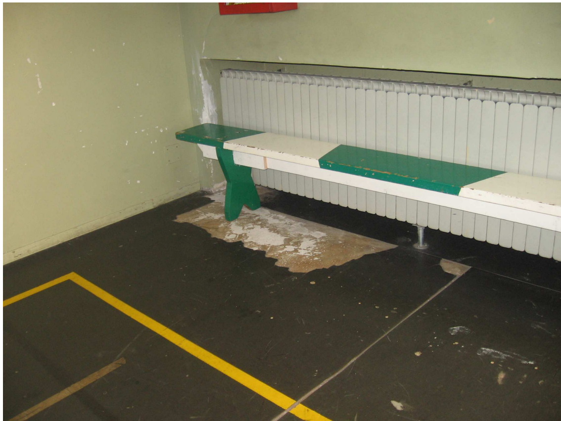
Foto n° 8 - Immagine particolare pavimento ammalorato e distaccato vicino ai termosifoni