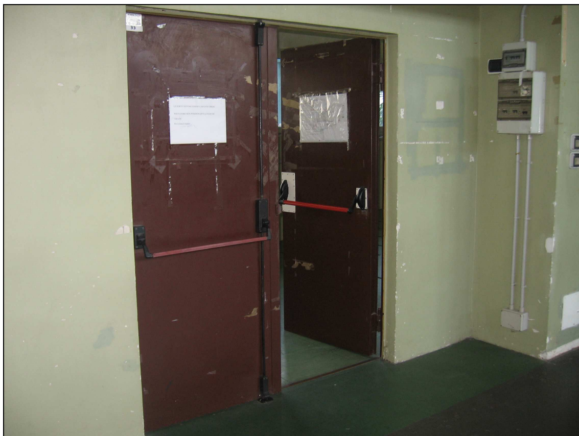
Foto n° 1 - Immagine entrata della palestra, particolare muri e pavimento rattoppato