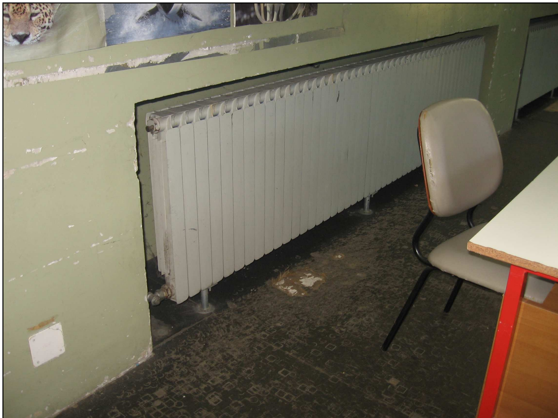
Foto n° 10 - Immagine particolare pavimento ammalorato e muri rovinati